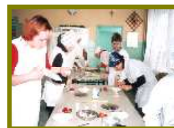
kucharz małej gastronomii

Praktyki zawodowe odbywają się w 4 pracowniach szkolnych wyposażonych i dostosowanych również do przeprowadzenia egzaminów zewnętrznych zgodnie z wymogami Okręgowej Komisji Egzaminacyjnej. Dodatkowo praktyki odbywają się poza szkołą na terenie miasta Grudziądz (Centrum Caritas, restauracje, bary).