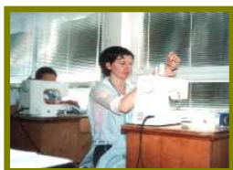
krawiec odzieży lekkiej

Dobrze wyposażone pracownie krawieckie w warsztatach szkolnych pozwalają nabyć umiejętności potrzebne w przyszłej pracy zawodowej. Uczniowie przechodząc przez wszystkie działy: krojownię, szwalnię, kontrolę jakości poznają żmudną drogę produkcji odzieży. Ogromną atrakcją są często organizowane pokazy mody i wystawy. Praktyki zawodowe odbywają się w 2 pracowniach szkolnych wyposażonych w maszyny krawieckie, stanowisko do krojenia oraz do prasowania tkanin. Dodatkowo praktyki odbywają się poza szkołą na terenie miasta Grudziądz ( Zakład Odzieżowy "Tęcza", Zakład Odzieżowy "Sara").