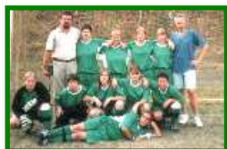
Złote medalistki w piłce nożnej dziewcząt Łódź 2003