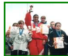
Nasi lekkoatleci na podium